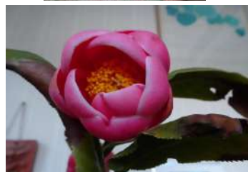
ベトナム原種椿(親)