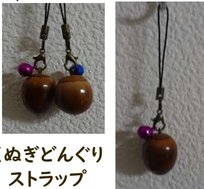
くぬぎどんぐりストラップ