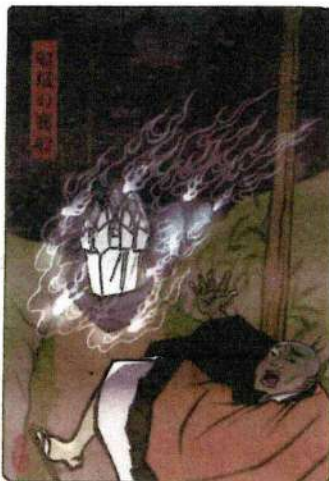
お手本 比叡山延暦寺HPより

その昔、比叡山は女人禁制の地であったため、山に強い憧れにも似た思いを残してこの世を去った女性達も少なからずいた。ある法師が夜、坂本から山へと戻る途中のこと、立ち込める霞の中、突如船が眼前に現れた。中には大勢の女の亡者が念仏を唱えながら乗っていた。その様を見た法師は気を失い、その後もうなされ続けたという。