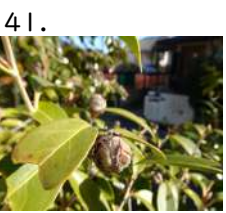
41. たいわんつばき種子 台湾椿 種子 開花日 yymmdd 撮影日 221125 松ぼっくりの種子に 似ている (No.13 前年開花分)