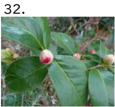
32. くすだま 楠玉 開花日 yymmdd 撮影日 221204