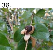
38. はいどうーん 蕾 ハイドウーン 蕾 開花日 yymmdd 撮影日 221212