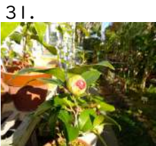
31. べにだいかぐら 紅太神楽 開花日 yymmdd 撮影日 221210 太神楽の親木と いわれています