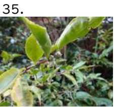
35. わーりんがーべる 蕾 ワーリンガーベル 蕾 開花日 yymmdd 撮影日 221005