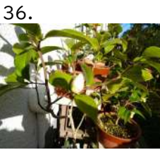
36. みしょうつたもみじ 実生蔦紅葉 蕾 開花日 yymmdd 撮影日 221212 2016/9実生 (No.15の種蒔) 初開花