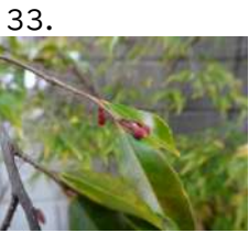
33. えりなかすけーど 蕾 エリナカスケード 蕾 開花日 yymmdd 撮影日 221005