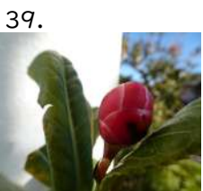
39. はいどうーん 種子 ハイドウーン種子 開花日 yymmdd 撮影日 221020