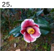
25. かくれいそ 隠れ磯 開花日 221212 撮影日 221212 日本の誉の枝変わり種 '14/2.24植栽