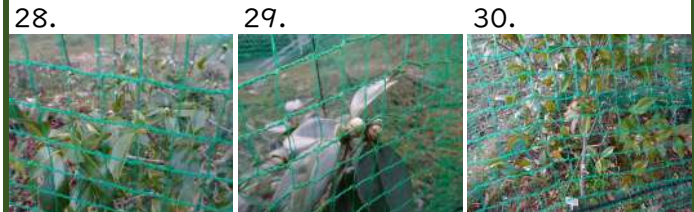
28. まんだらつばき まんだら椿 開花日 yymmdd 撮影日 221214 29. べにあさひ 紅朝日 開花日 yymmdd 撮影日 221214 30. ハルサザンカえがお ハルサザンカ笑顔 開花日 yymmdd 撮影日 221214 2020年ソメイヨシノ公園植樹種 集会所前斜面植樹