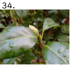
34. みかわうんりゅう 蕾 三河雲龍 蕾 開花日 yymmdd 撮影日 221005