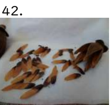
42. たいわんつばき種子 台湾椿 種子 開花日 yymmdd 撮影日 221125 松ぼっくりの種子に 似ている (No.13 前年開花分)