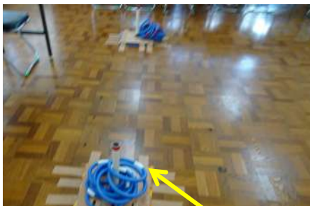
輪(リング)は重心のある継ぎ目を持って