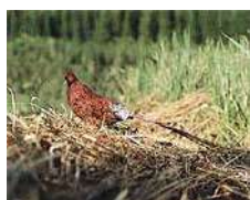
x コシジロヤマドリ