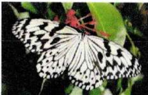
県の蝶「オオゴマダラ」

色彩豊かな美しい魚で広く庶民に親しまれている 沖縄では数少ない大衆魚として広く県民の食卓に普及している