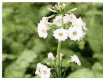
府の花「さくらそう」