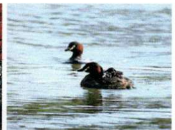
県の鳥「かいつぶり」