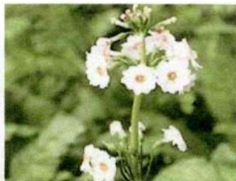
府の花「さくらそう」