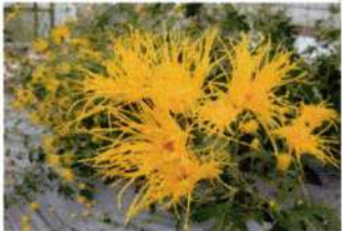
府の草花「嵯峨ぎく」

この府章は 府民から公募して制定 六葉形は古都の格調高い土地柄を表現し 中央に「京」の文字をひとがたに図案化して配し 全体として府民の連帯性とその力の結合を表象したものです (昭和51年11月2日制定)