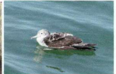
府の鳥 「オオミズナギドリ」