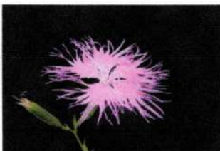
府の草花「なでしこ」