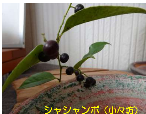
シャシャンボ (小々坊)