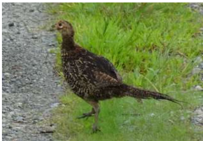
8月28日撮影 農道を単独で歩いていました (ローズ診療所に通じる農道) 同時刻に8羽のヒナを連れた親子を近くで見かけました。

この時期 雄のけたたましい求愛と縄張りを主張する雄叫びは全く耳にしなくなりましたが 単独で行動する個体をよく見かけます。 また 耳をすませるとヒナたちの『ピッ ピョッ ピョッ ピッ』と餌を見つけて大喜びしているかのような鳴き声を(かすかに)聴くことがあったりします。