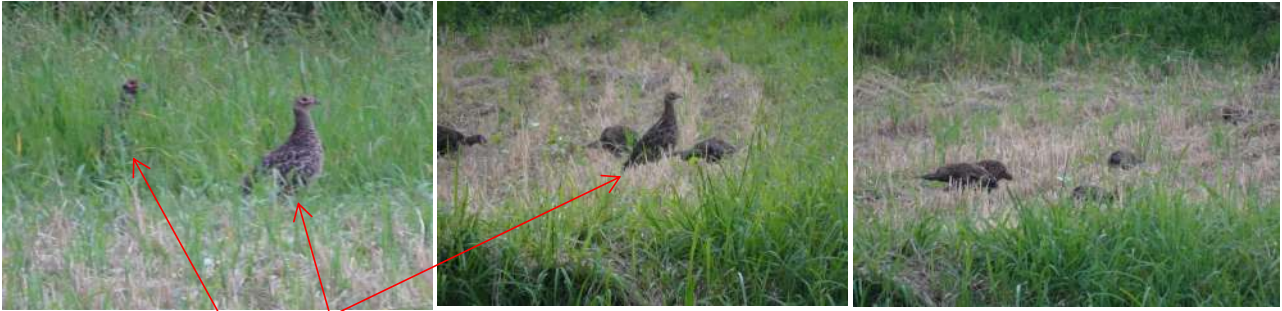
9月8日撮影 雄ヒナと母キジ 稲刈りの後の田んぼでヒナたちは 夢中で 何かを啄んでいるようです 前ページの大豆畑より2~300m西に位置する場所です

9月10日午前7時過ぎ (かなりの至近距離です。2~3m前後?) 上記とはかなり離れた大豆畑(飛んで飛んでの大豆畑より更に2~300m東寄り)で キジの親子を発見。顔(目の周り)が随分と赤くなっています。母キジは相変わらず周囲に目配 りをしています。