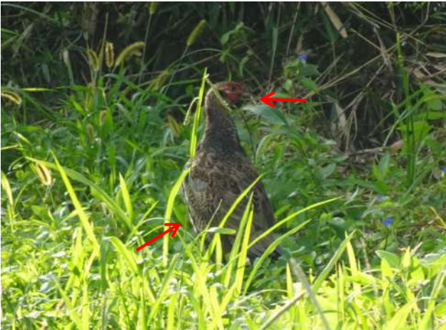
雄ヒナ 顔の付近は赤く 羽根色も心なしか変化を

↓ 雑木のある草地にて ここでジャンプして飛び上がっていました ↓ 南下の大豆畑のあぜ道で佇む親子(飛び下りた後)