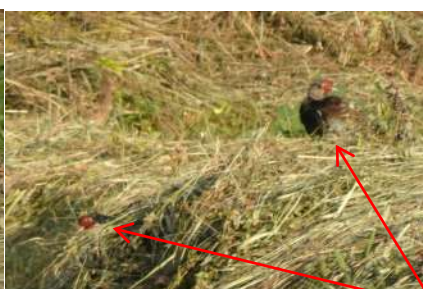
オス メス 母キジ