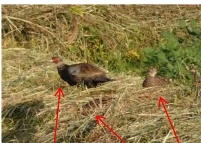
オス メス 母キジ