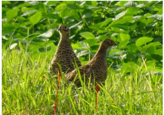
母キジ と 雌ヒナ

9月15日午前7時30分頃 (上記の一枚南側の大豆畑のあぜ道) いつものキジの親子の近くに 成鳥のオスがウロウロしていました。逆光の為少し分かりにくいですが 大人の雄です。雄のヒナ(というには少し大きくなりましたが)も複数確認できます。