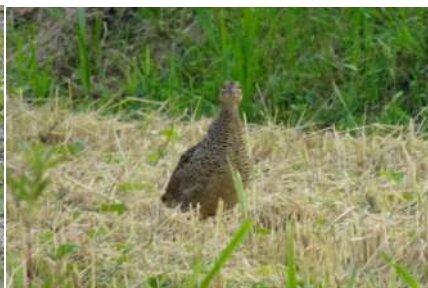
8月30日撮影 稲の刈取りが終わった田んぼで一羽 こちらを見つめています 左の写真と同一個体かどうかは不明です