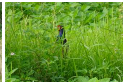
8月30日撮影 左の写真の少し南側の草むらでひっこりさんをしているオスを見かけました