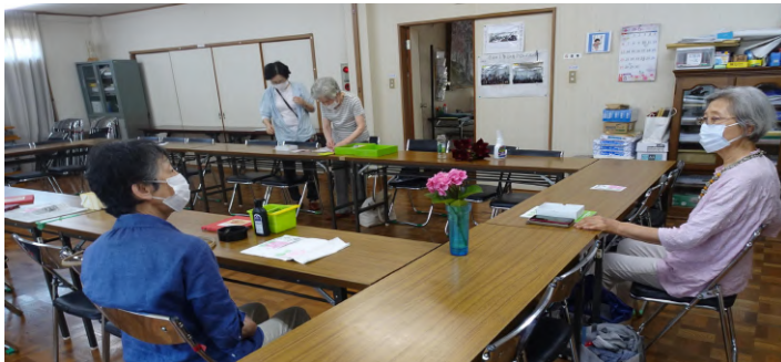
開始前の和やかな談笑タイムです