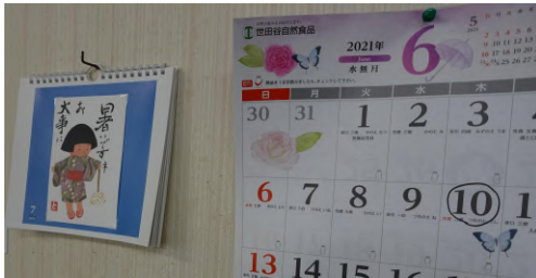
↑ 『絵手紙』カレンダー

『絵手紙』教室のスタートは古く 集会所の開放を始めた時からなので 10年以上となり 忘れてしまうほど前からやっているとのこと『あの頃は みんな若かったワッ』と 皆さん懐かしそうに 笑い飛ばしながら 話されました。