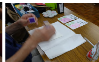
文字の練習をする人 スタンプを繰り返し押す人 彩色する人・・・