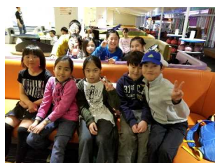
3/22 歓送迎会:ボーリング