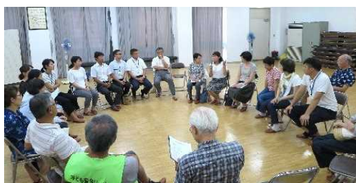
第2回「小野小学校学校運営協議会」発表と意見交換会

この一年間で20以上の事業、延べ300人以上の住民が小野小学校の教育活動に協力した。総括の中で学校長から、子どもたちの安心安全に繋がり、専門的な技術に至っては教師も学び子どもたちもいきいきと効率的に学ぶことができたなどと深甚な感謝の意が述べられた。