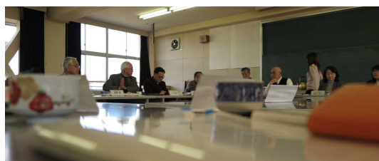
第3回「小野小学校学校運営協議会」寸景

さらに新年度に向かっての新たな取り組み案、子どもたちとの「ふれあいを深める広場」（週1回）の実施などを確認した。